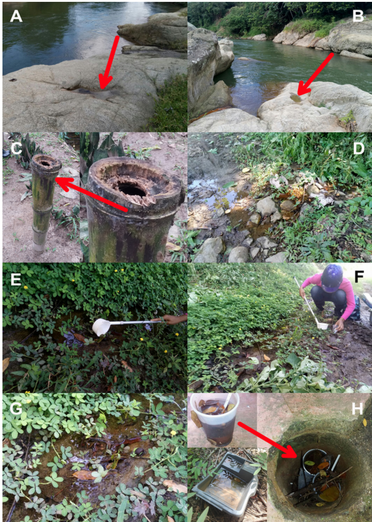
Figura 1. Lugares de cría de Culex (Culex) garciai . A-B: huecos de roca; C: agujero en bambú; D-G: huellas de vehículos; H: recipientes plásticos.

Figure 1. Culex (Culex) garciai aquatic habitats. A-B: rock pools; C: bamboo holes; D-G: vehicles trails; H: plastic containers.